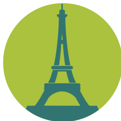
Illustration : Marie Gravier"